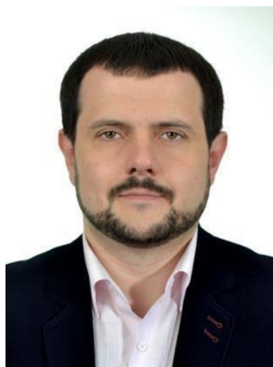
Начальник виробничого відділу №6: