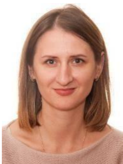
Начальник виробничого відділу №3: