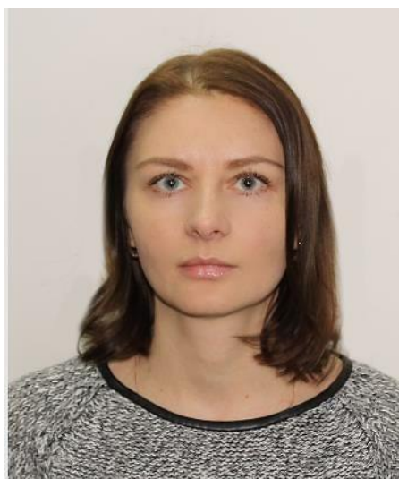
Начальник виробничого відділу №7: