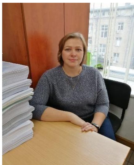
Начальник виробничого відділу №4: