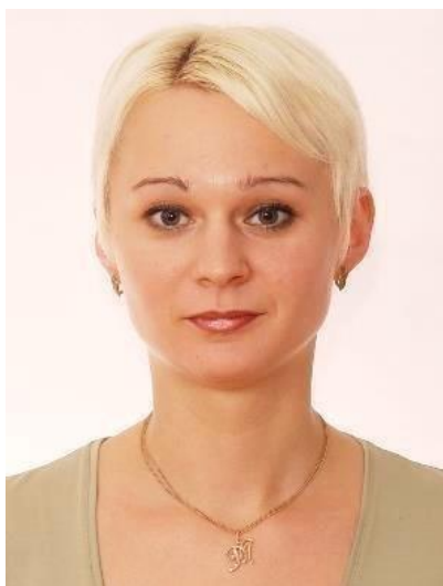
Начальник виробничого відділу №1:

Виконання робіт по розробленню документацій із землеустрою, по інвентаризації земель, топографо-геодезичних, картографічних робіт, робіт по експертній грошовій оцінці земельних ділянок.