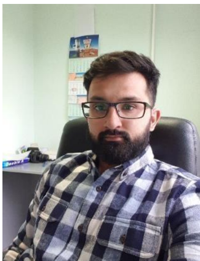
Начальник виробничого відділу №5: