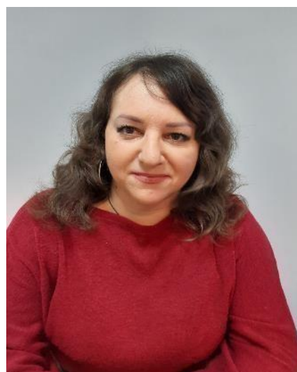
Начальник виробничого відділу №8: